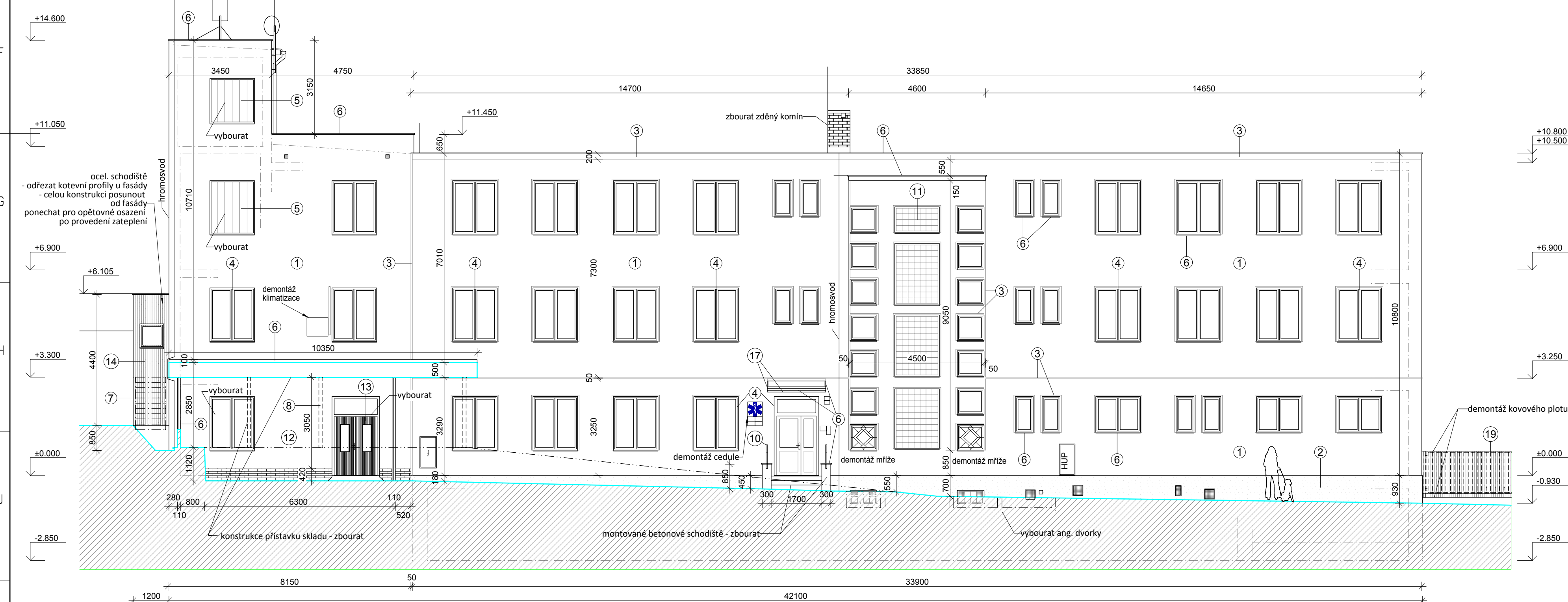
POHLED SEVEROVÝCHODNÍ 1:100