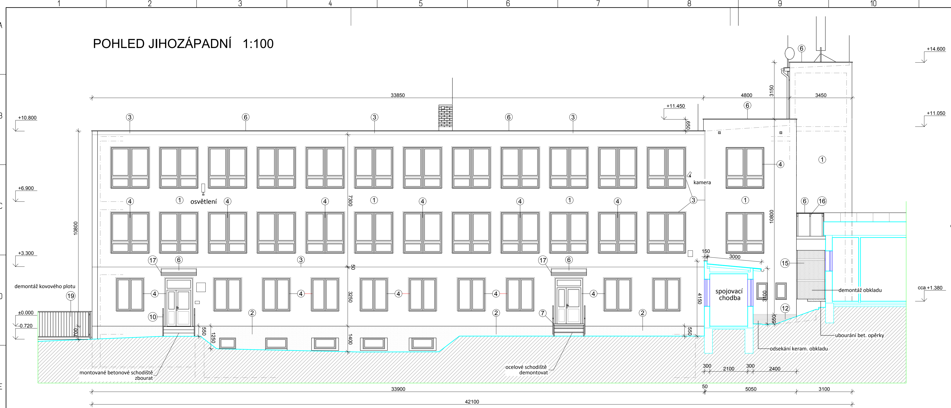
POHLED JIHOZÁPADNÍ 1:100